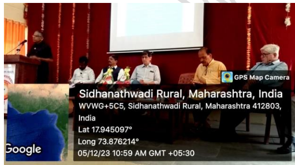
CA SURESH MEHATA DELIVERING GUEST LECTURE