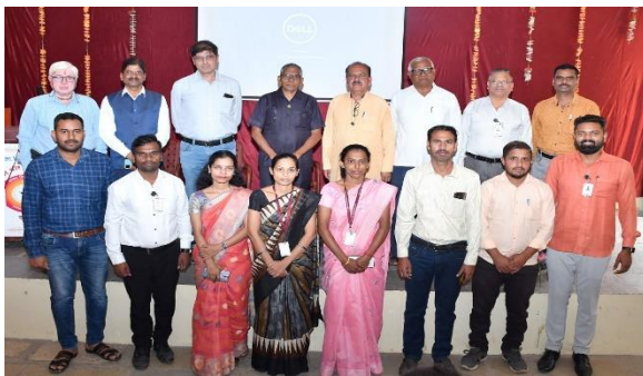
STAFF WITH DIGNITORIES DURING THE PROGRAM